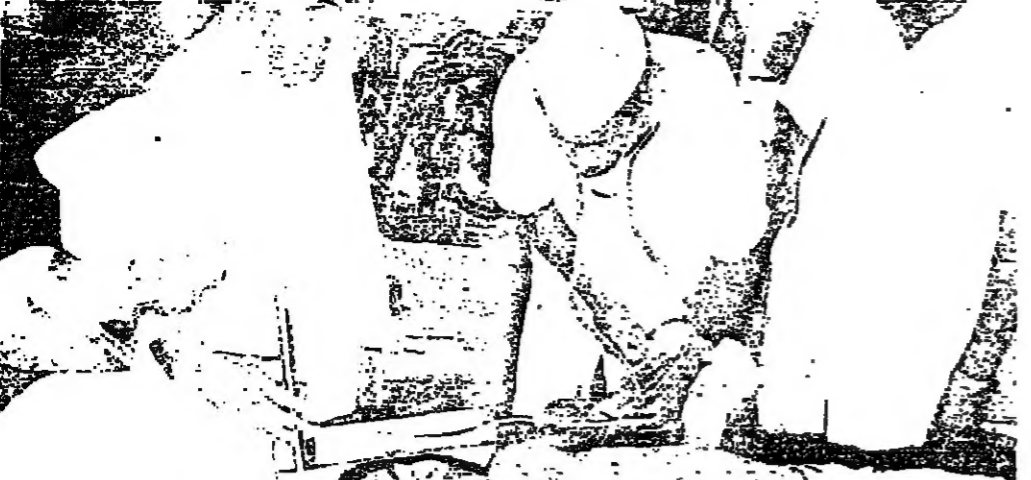
جانب من الأسلحة والمبالغ الضخمة من الأموال المصدرة من الانفطالبيين

قال الدكتور زعت الحبيب وزير الخارجية المصري في مقابلة مع وكالة الأنباء المصرية: إن مصر لن تدخل الحرب إذا اعتدت إسرائيل على سوريا. وأضاف أن مصر ستدعم سوريا في أي مواجهة عسكرية.